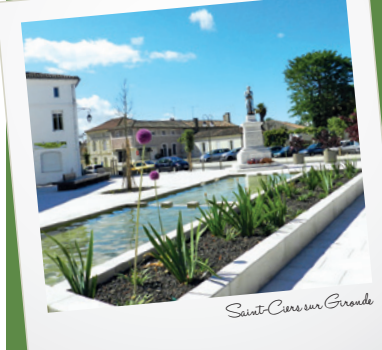
Saint-Ciers sur Gironde